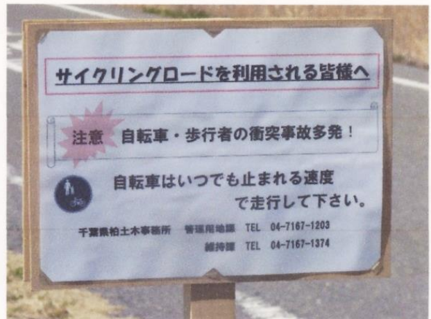
ファイル名 : 02 サイクリングロードの注意喚起看板- .JPG Tv (シャッター速度) : 1/500 Av (絞り数値) : 5.6 露出補正 : 0 ISO感度 : 80