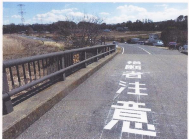
ファイル名 : 04 横断者注意の路面表示.JPG Tv (シャッター速度) : 1/320 Av (絞り数値) : 5.6 露出補正 : 0 ISO感度 : 80