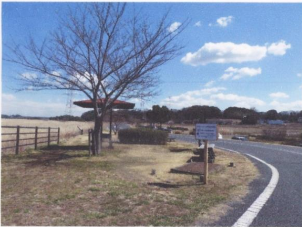
ファイル名 : 03 注意喚起看板の設置例.JPG Tv (シャッター速度) : 1/400 Av (絞り数値) : 5.6 露出補正 : 0 ISO感度 : 80