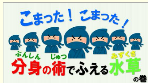
『手賀沼流域のこまった水草』 美手連デジ PT 運営事務局