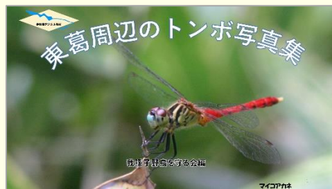
我孫子野鳥を守る会