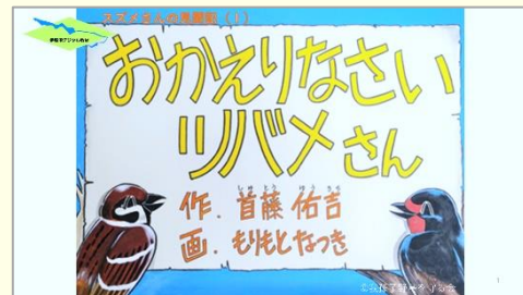
『デジタル紙芝居スズメさんの見聞記 5 作品』 我孫子野鳥を守る会