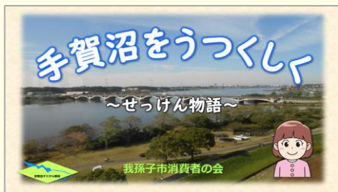
我孫子市消費者の会 ※