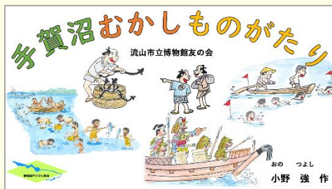
流山市立博物館友の会 ※